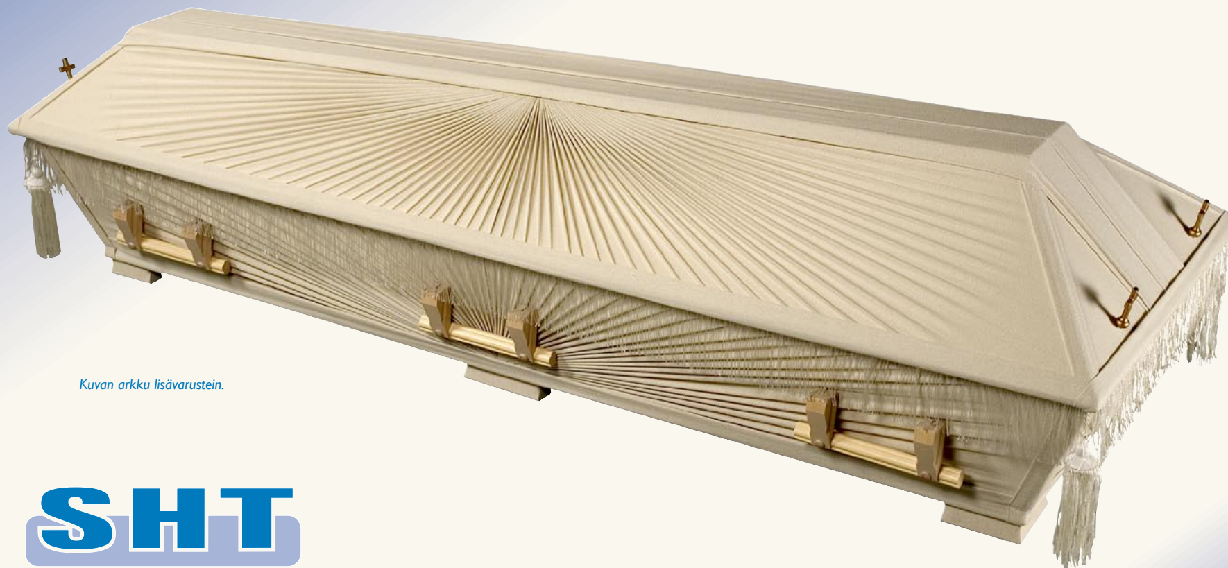
Kuvan arkku lisävarustein.